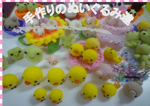
手作りのぬいぐるみ

ご家族の不安な気持ちを少しでも軽減できるように、過ごしやすい場所となるよう心がけています。