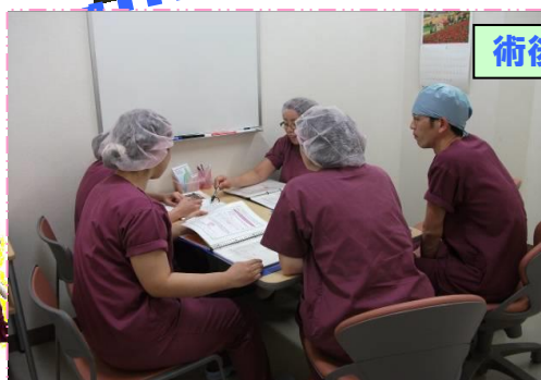
術後カンファレンス

手術前から手術後までしっかり患者様と関われるように、術前、術後訪問を行っています。手術看護を振り返り、問題や対応に困ったことなどを、スタッフ全員で一緒に考え、情報共有しています。