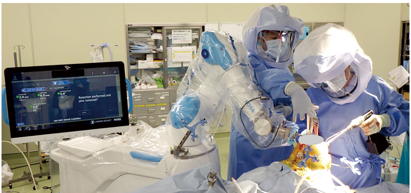
図5 術中写真 真ん中がロボットアーム ロボット支援で骨を切るところ