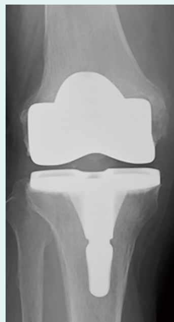
図3 人工膝関節置換術後